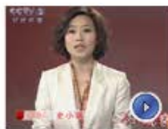
直降7000 推倒房价多米诺?