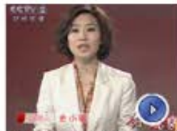
直降7000 推倒房价多米诺?