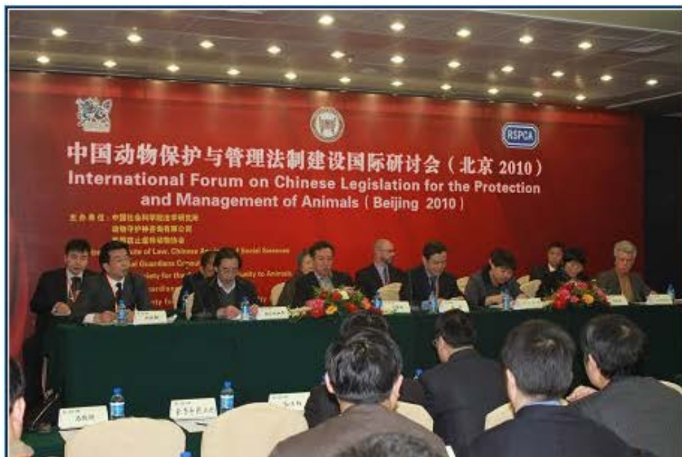
今年3月在北京举行的关于动物保护的国际研讨会。